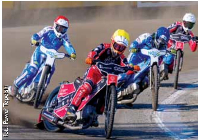
Zawody żużlowe w Tarnowie