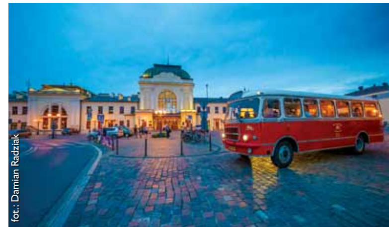
Zabytkowy autobus przed tarnowskim dworcem kolejowym