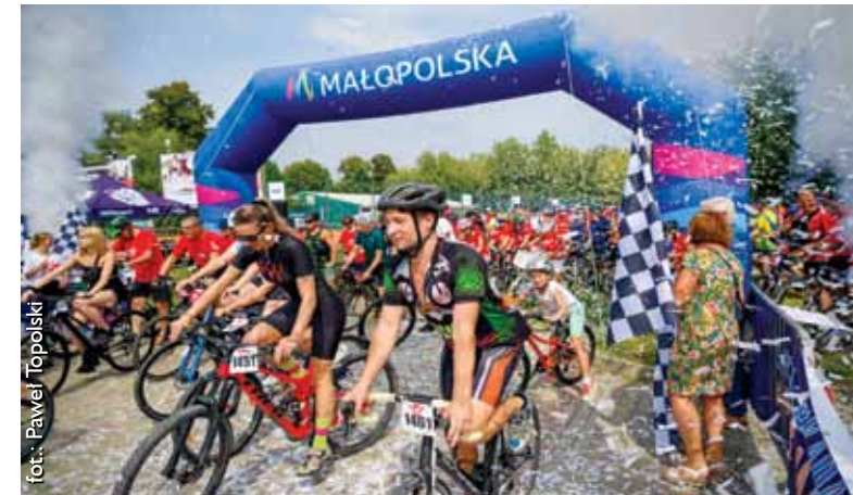
Rodzinny rajd rowerowy „Małopolska Tour”