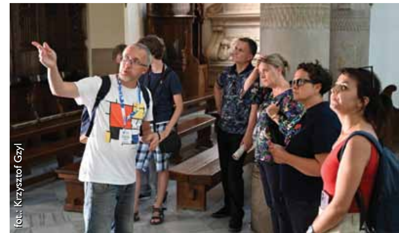
Spacer po Tarnobrzegu z przewodnikiem