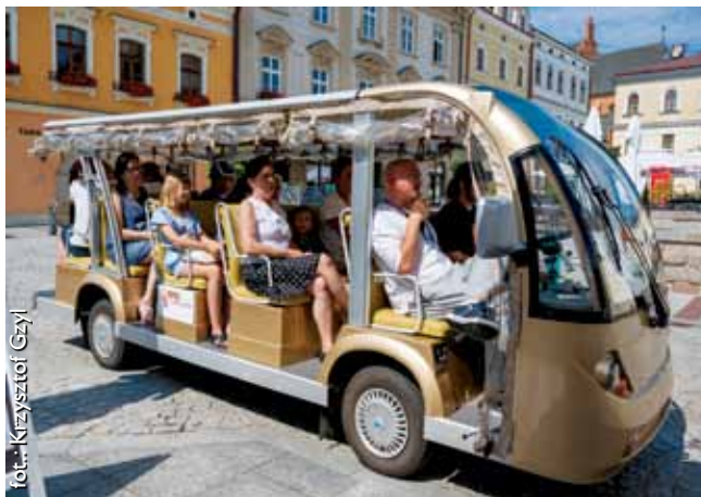
Enomeleksem po Tarnowie