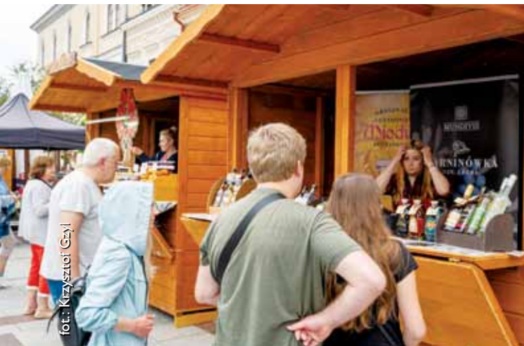
Jarmark Galicyjski w Tarnowie