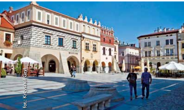
Renesansowe kamienice na rynku w Tarnowie