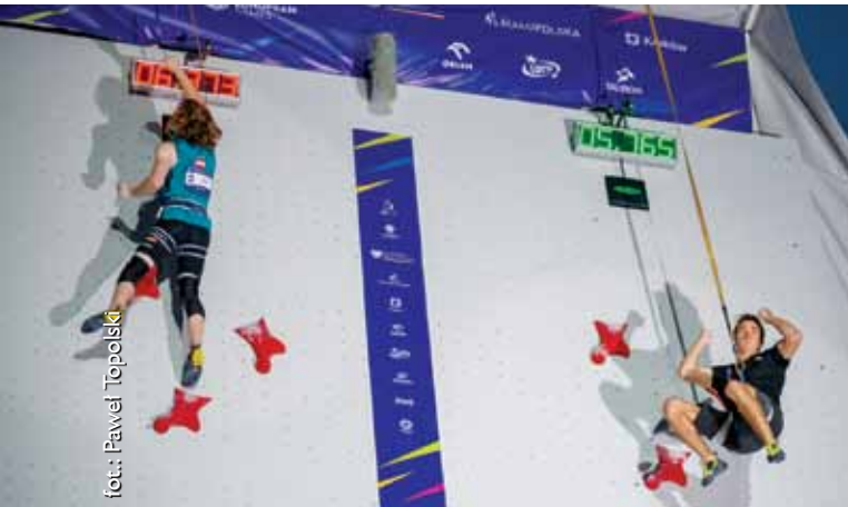
Wspinaczka sportowa na czas (Igrzyska Europejskie 2023)